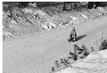
Б – санный спуск