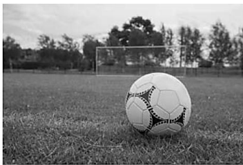
А – футбольное поле

3.3. Какой из изображённых на фотографиях объектов может быть сооружён на участке, по которому проходит маршрут А–В? Укажите в ответе букву, которой обозначен этот объект.