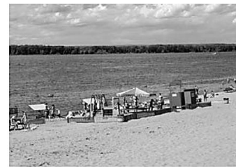
В – пляж